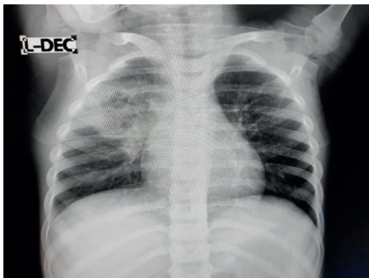
Figura 2. Radiografía de tórax evolutiva

Se decide realizar exudado nasofaríngeo. Se indica radiografía de tórax evolutivo según protocolo de seguimiento (figura 2) encontrándose empeoramiento radiológico, observándose mayor celularidad y aéreas centrales con tendencia redondeadas con contenido aéreo (por atrapamiento de aire). Mantiene aspecto inflamatorio bronconeumónico en evolución.