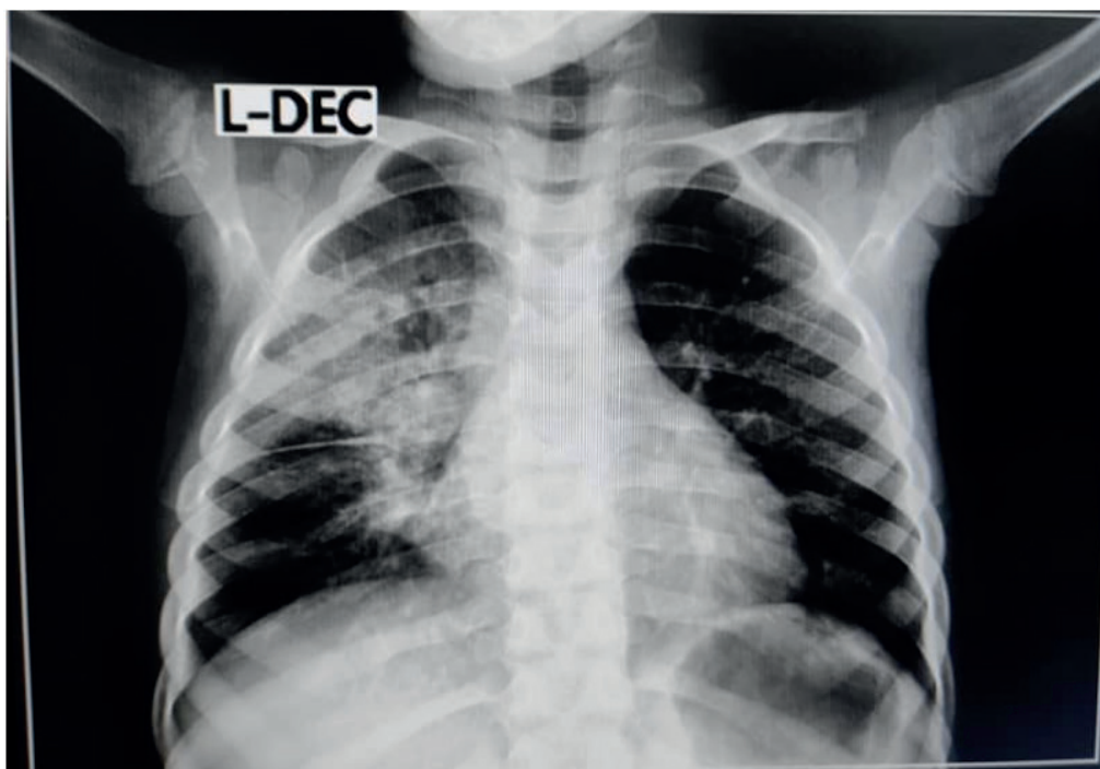
Figura 1. Opacidad heterogénea que interesa segmentos superior y medio del CPD con aéreas opacas y radiotransparentes y cisuritis media derecha aguda, de aspecto inflamatorio bronconeumónico con participación pleural

Al examen físico se encontró un paciente con buen estado general, donde solo resultó positivo la presencia de estertores crepitantes en base pulmonar derecha. Se indicó radiografía de tórax anteroposterior, la cual mostró opacidad heterogénea que interesa segmentos superior y medio del campo pulmonar derecho con aéreas opacas y radiotransparentes, y cisuritis media derecha aguda, de aspecto inflamatorio bronconeumónico con participación pleural (Figura 1). EL ultrasonido de bases pulmonares mostró reacción pleural derecha con hepatización del parénquima pulmonar e imágenes ecorrefrignentes por broncograma aéreo.